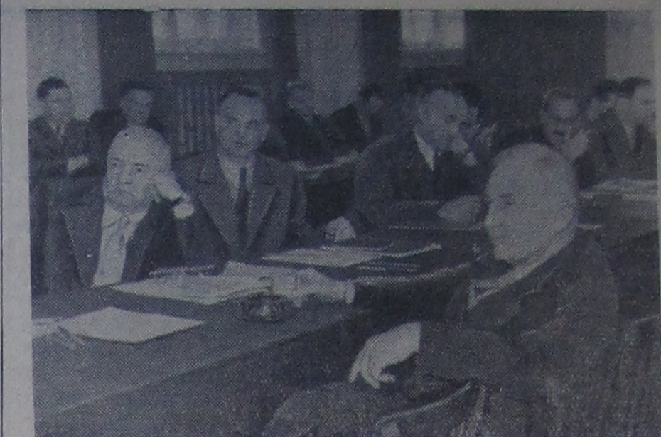
В ноябре в Объединенном институте ядерных исследований работал Ученый совет.