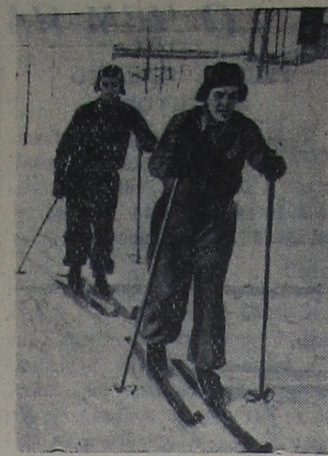
На лыжной прогулке.