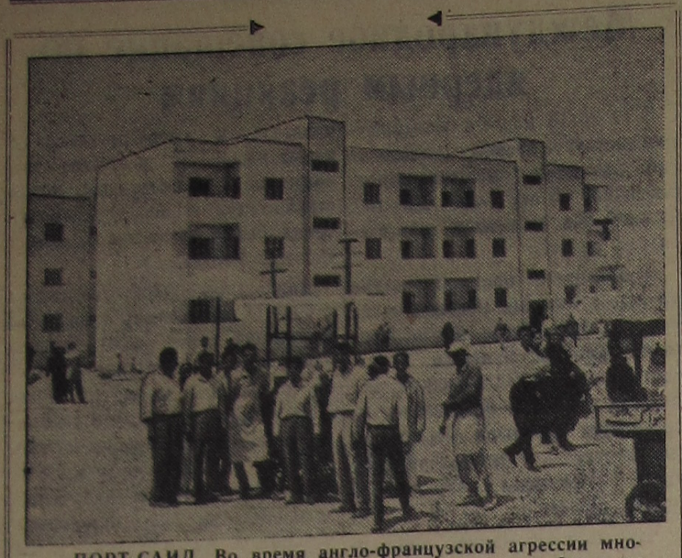
ПОРТ-САИД. Во время англо-французской агрессии многие здания в городе были разрушены захватчиками. Сразу же после освобождения развернулось большое строительство. Были восстановлены здания, пострадавшие частично, и заложено 188 новых жилых корпусов. Сейчас свыше ста зданий уже построено, и сооружение остальных подходит к концу. На снимке: новые жилые корпуса в районе Аль-Манак.