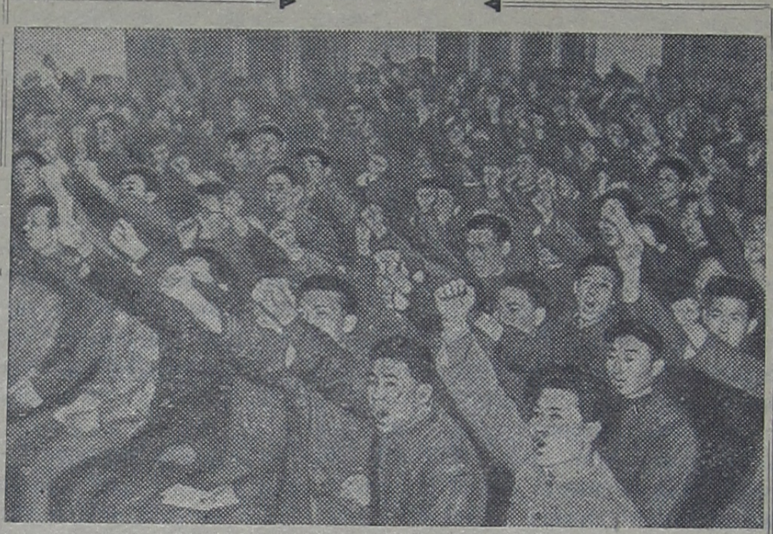
Трудящиеся Корейской Народно-Демократической Республики горячо поддерживают новые предложения правительства КНДР по вопросу мирного объединения Кореи. По всей стране проходят митинги в поддержку этой инициативы. На снимке: митинг студентов Кимчакского инженерного института в поддержку заявления Кабинета министров КНДР.