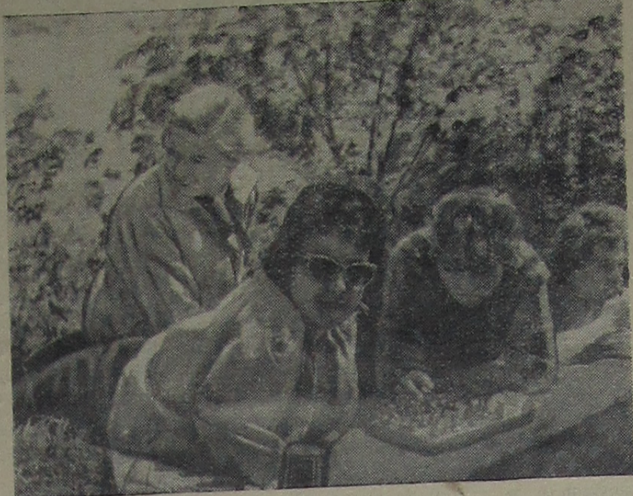
В выходной день.

Санаторий «Дорохово» — самая крупная здравница Подмосковья. Каждый месяц здесь будут отдыхать 350 человек.