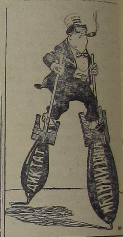
С «позиции силы»

или американские ходули. Рис. А. Брусиловского (г. Харьков)