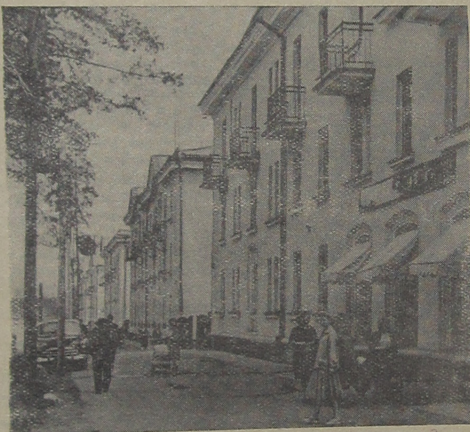
Растет и благоустраивается наш молодой город. Строятся новые дома, ясли, открываются магазины. На снимке: одна из центральных улиц города — Южная. Здесь работает магазин по продаже обуви и одежды.