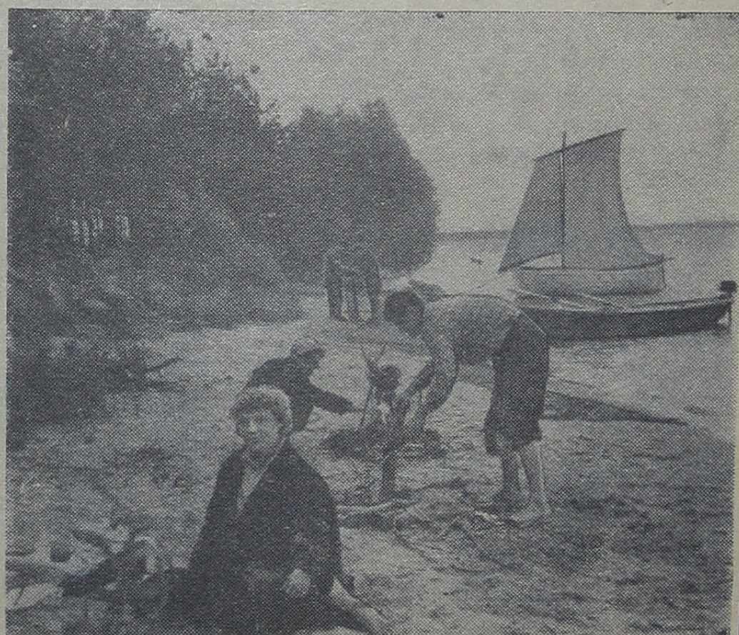
Дубненцы на Московском море.