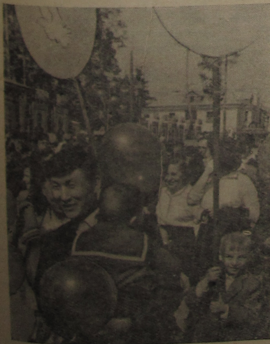
На первомайской демонстрации.

Конференция изберет новый состав горкома профсоюза. Безусловно, в него будут избраны лучшие люди, способные правильно организовать работу по выполнению решений XXI съезда КПСС и XII съезда профсоюзов Советского Союза.