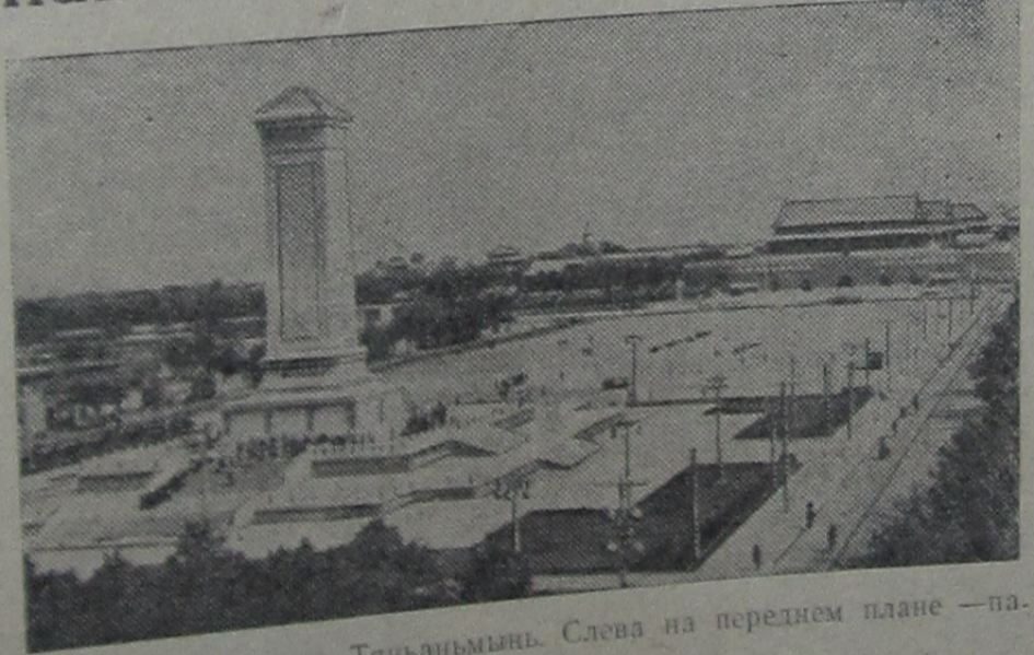
ПЕКИН. Площадь Тяньаньмынь. Слева на переднем плане — памятник народным героям.

Значительны достижения не только в деле строительства родного города. Особенно большой успех получило строительство в 1958 году. Одним из главных сооружений были Шиньинский