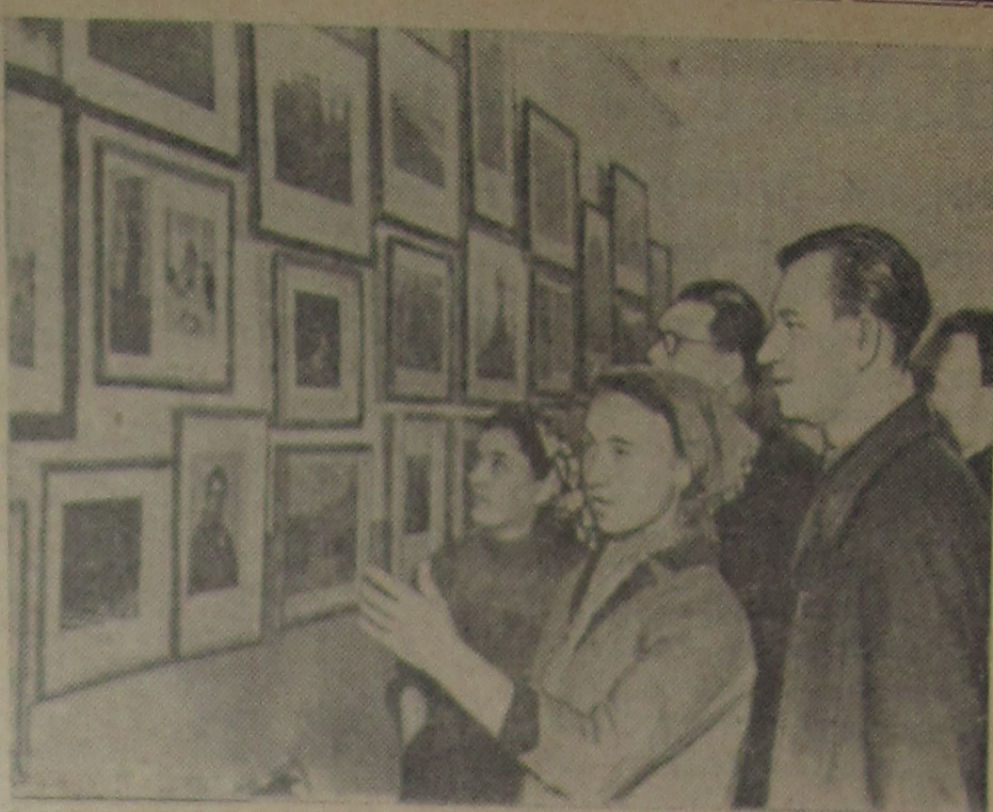
К 10-й ГОДОВЩИНЕ КНР

Для повышения устойчивости и стабильности никель-цинк при гальваническом полировании нержавеющей стали применяют следующий состав электролита, взвешенных в литры: 40 г хлоридов цинка, 1,4 г, 7 г оксидов цинка, 1,16 г, 2,3 г оксидов цинка, 1,84 г, 66 г оксидов цинка, 5 г литр кислоты, 10 г литр кислоты, 5 г литр кислоты, 3 г литр кислоты.