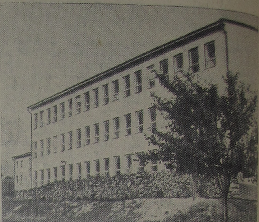
За последние 11 лет в Чехословакии ежегодно строилось почти 100 новых школ — в три раза больше, чем за все время существования довоенной республики. На снимке: новая средняя школа в рабочем поселке Гриневе Банскобыстрицкой области.