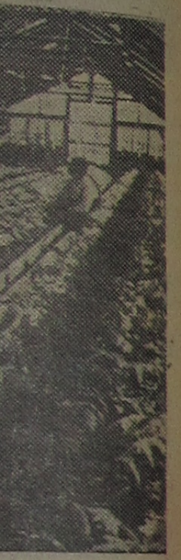
Члены... Ок Хи в уезде... д выращивают

Республики... работы. В бли... будет осушено 100 тысяч гек... мощные земле... работах в бас... Троицы Градец... Чехословацкое... аграфное агентство