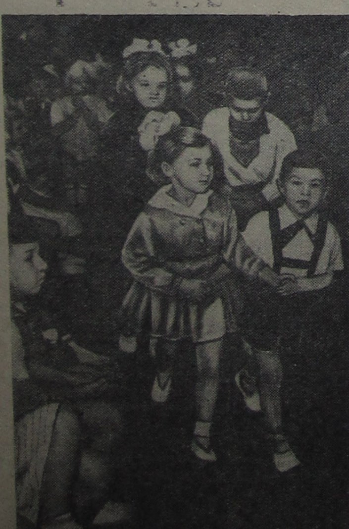
Весело отдыхают малыши в детском садике № 6.

* За каждую минуту на квадратный метр поверхности земли падает столько солнечной теплоты, что ее хватало бы, чтобы довести до кипения стакан воды. А на каждый гектар земной поверхности в секунду приходится столько солнечной энергии, что она могла бы приводить в движение мотор мощностью 10 тысяч киловатт.