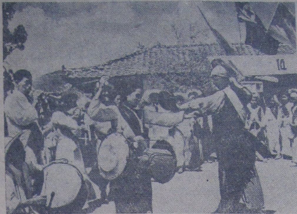
Корейская Народно-Демократическая Республика. На сельском празднике.