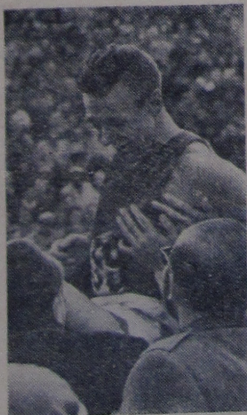
На снимке: зрители приветствуют нового рекордсмена мира в беге на 10.000 метров П. Болотникова.