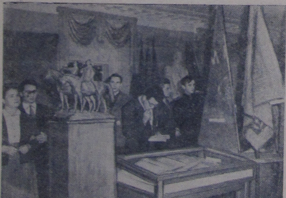
Москва. В Центральном Доме Советской Армии имени М. В. Фрунзе открыта выставка, посвященная 40-летию разгрома войск Врангеля и окончания гражданской войны в СССР.