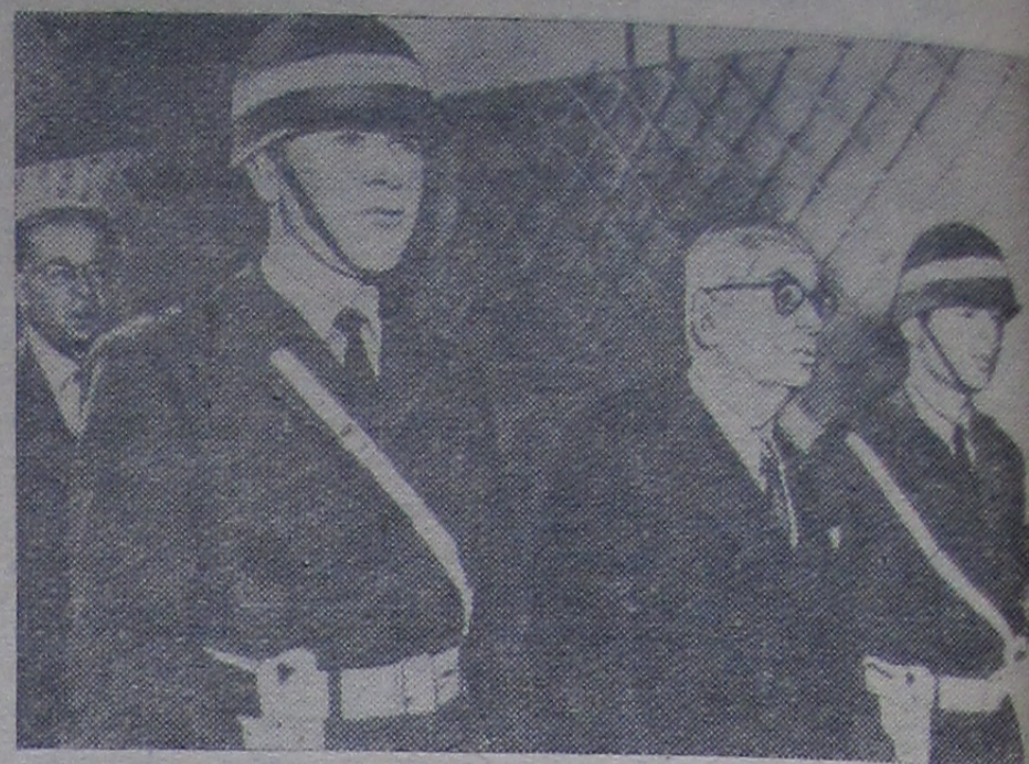
Турция. На острове Ясыада в Мраморном море ведется судебный процесс по делу бывших руководителей турецкого правительства и деятелей правившей демократической партии, проводивших антинародную авантюристическую политику и свергнувших в результате государственного переворота в мае этого года. Подсудимым предъявлено обвинение в нарушении конституции, многочисленных злоупотреблениях и преступлениях. На снимке: конвой сопровождает бывшего президента Джалала Баяра в судебный зал заседаний.