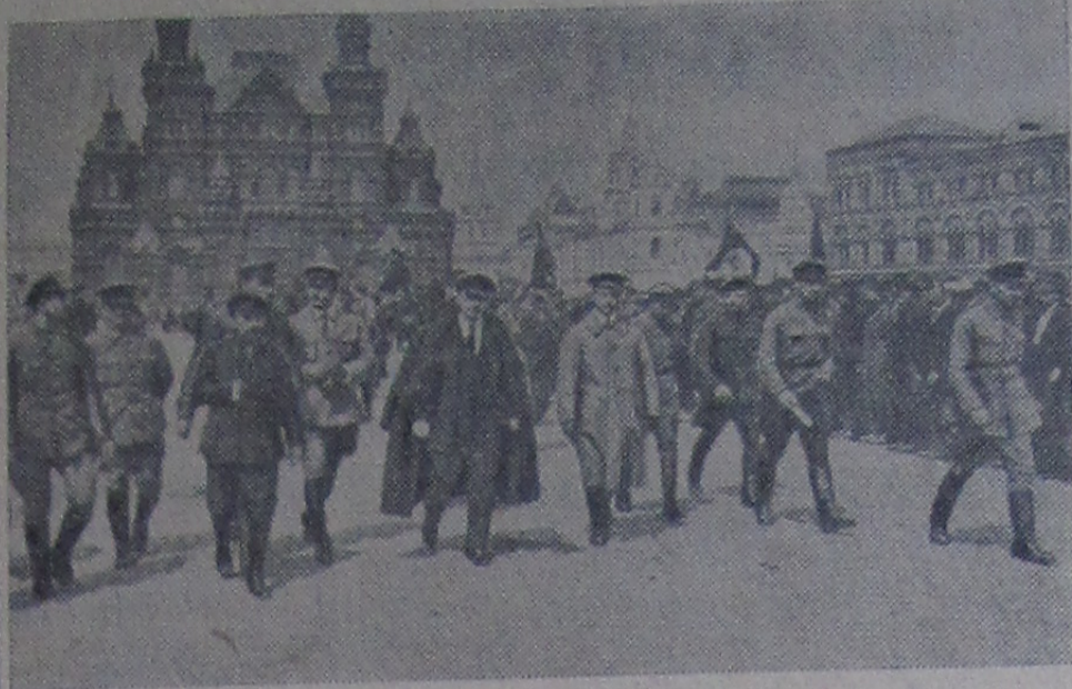
В. И. Ленин обходит фронт войск Всеобуча на Красной площади 25 мая 1919 года.