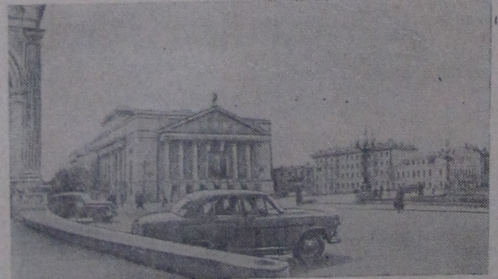
Казань — крупный промышленный и научно-культурный центр страны. Здесь имеется много учебных и научных учреждений, работают оперный, русский и татарский драматические театры, консерватория, 30 клубов и дворцов культуры. Гордостью казанцев и всех трудящихся республики является монументальный театр оперы и балета, носящий имя героического сына татарского народа Мусы Джалиля. На снимке: площадь Свободы в Казани. Слева — здание театра оперы и балета имени М. Джалиля.

27 мая — 40 лет со дня образования Татарской АССР