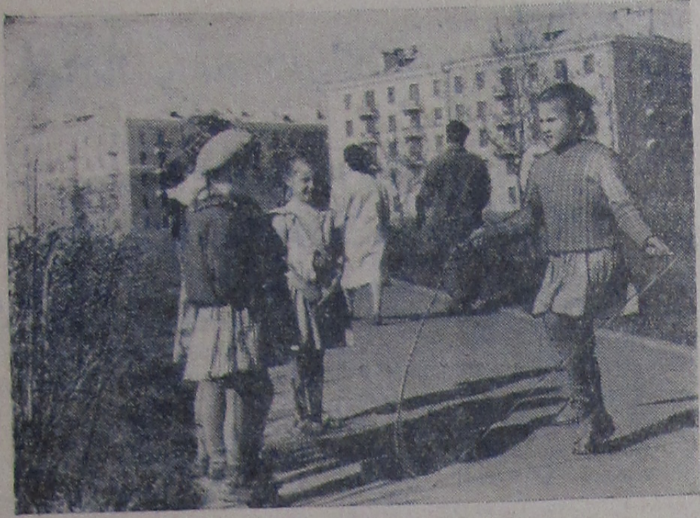
Хорошо скакать!

В настоящее время уже 9 округов республики являются полностью кооперированными.