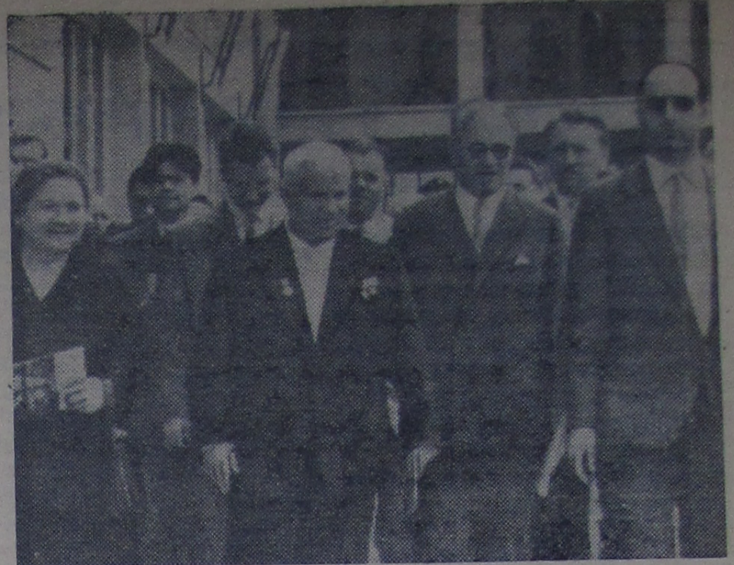
Пребывание Председателя Совета Министров СССР Н. С. Хрущева в Австрии.

На снимке: Н. С. Хрущев и сопровождающие его лица осматривают водолечебницу «Терезиенбад».