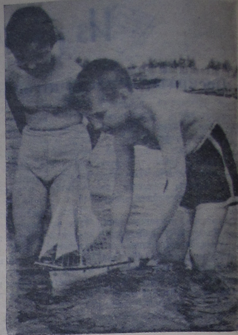
Многие школьники Иванькова с увлечением строят «корабли». На снимке: будущие капитаны за пуском своего корабля.