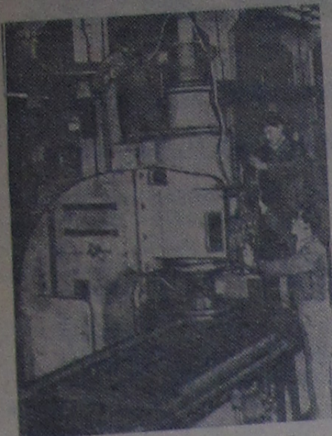
Китайская Народная Республика. На Шанхайском станкостроительном заводе изготовлен первый в стране шлифовальный станок, предназначенный для точной обработки поверхностей.