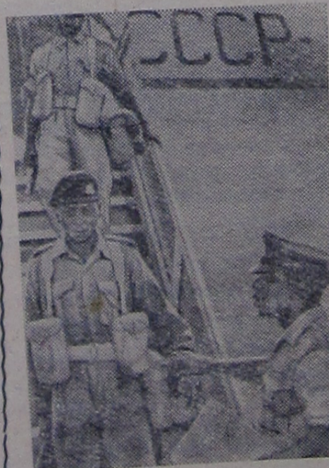
21 июля в Леопольдвиле прибыли четыре советских самолета «ИЛ-18», доставившие продовольствие для населения Республики Конго, а также ганские военные подразделения, входящие в состав войск ООН. На снимке: выгрузка ганских военных подразделений на аэродроме в Леопольдвиле.