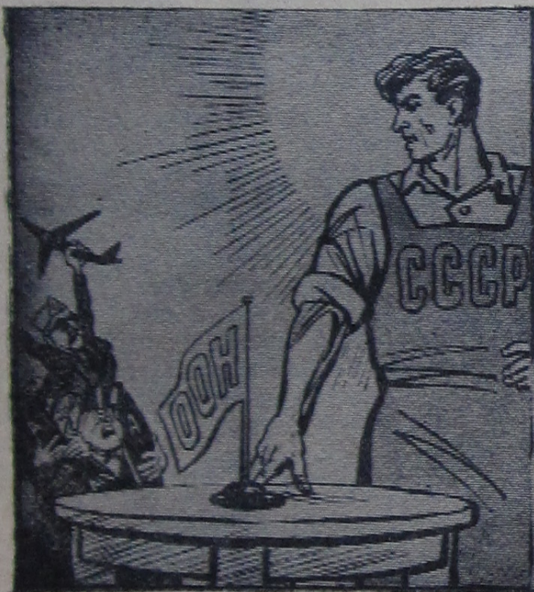
Оружие на стол!

Можно не сомневаться, что наступивший год принесет дальнейшее признание выдающихся успехов социалистической науки по исследованию мирного атома.