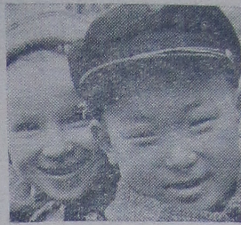
Хорошо нам вместе.

Чудесная жизнь ждет нас и наших детей. Мы уже видим, какими они станут через 20