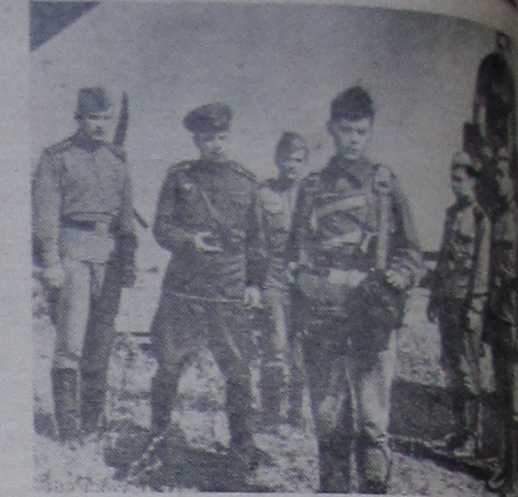
Кадр из новой кинокартины «Привок на заре» киностудии имени М. Горького. Фильм поставлен режиссером кинским по сценарию Г. Березко.

Н. Гусаров, начальник инспекции пожарной охраны.