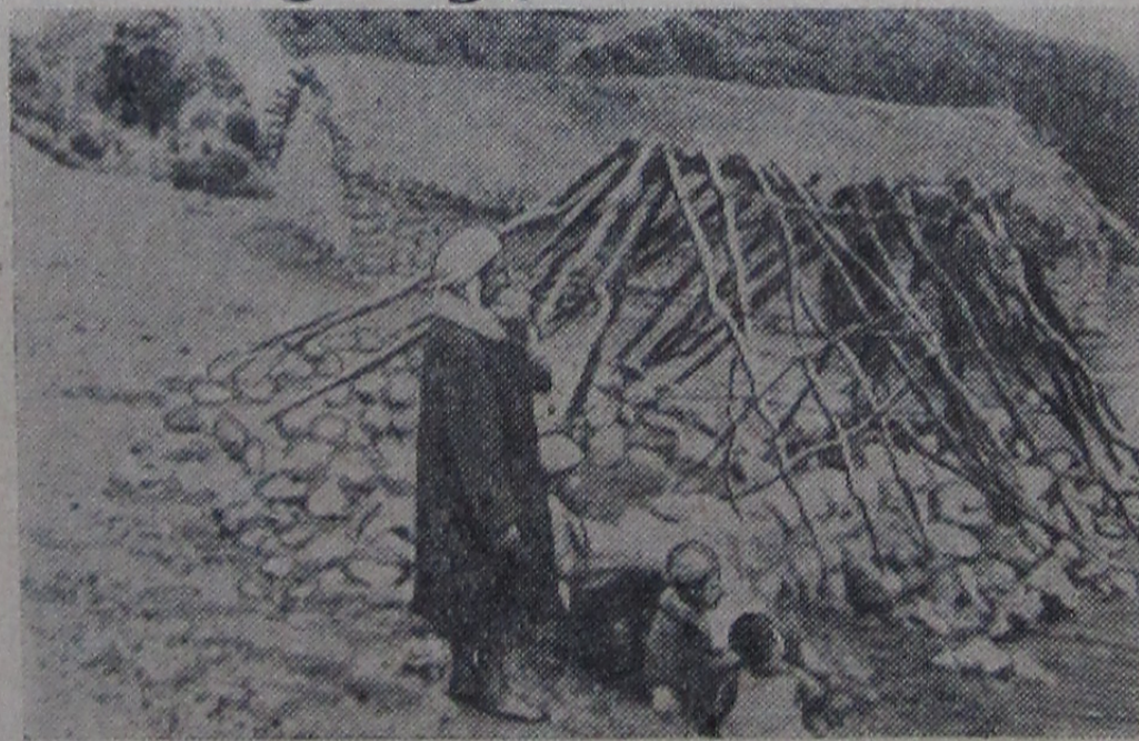
АЛЖИР. В деревне, освобожденной Алжирской национально-освободительной армией.