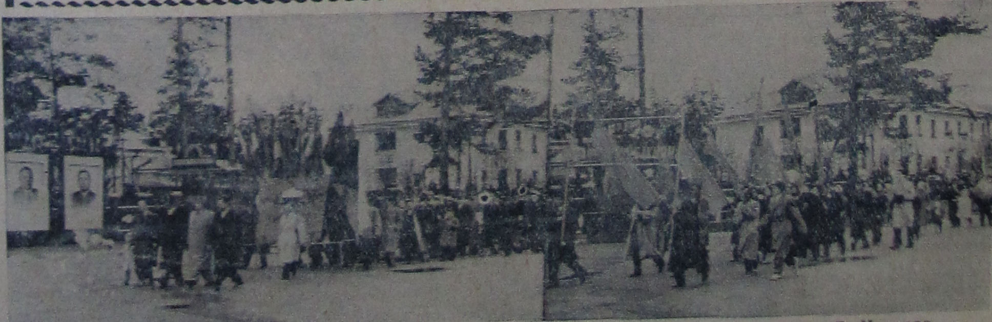
Первомайская демонстрация в Дубне.