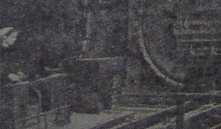
На снимке: в новом цехе.

Ежегодно предприятие будет выпускать 60 тысяч кубометров газобетона, что позволит возводить из легких и прочных панелей 60 тысяч квадратных метров жилья в год.