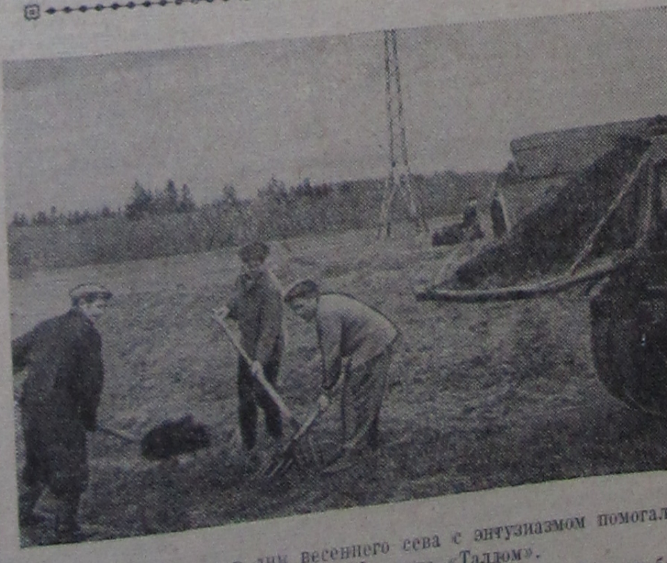
Многие дубненцы в дни весеннего сева с энтузиазмом помогали своему подшефному — коллективу совхоза «Талдом». На снимке: сотрудники Лаборатории высоких энергий за работой в поле.