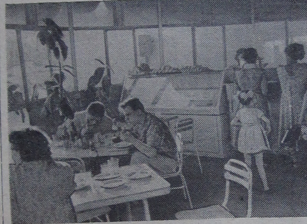
Недавно в институтской части города открылось летнее кафе. Здесь всегда большой выбор молочных продуктов, кондитерских изделий, кофе, чая и других напитков. На снимке: в новом кафе.