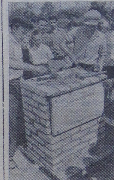
Неподалеку от парка имени К. Э. Циолковского в Калуге состоялась торжественная церемония закладки государственного музея К. Э. Циолковского.