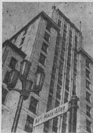
Берлин. Высотное здание на Карл-Маркс-аллее.

ПАРТИЙНЫЙ КОМИТЕТ КПСС ОБЪЕДИНЕННОГО ИНСТИТУТА ЯДЕРНЫХ ИССЛЕДОВАНИЙ.