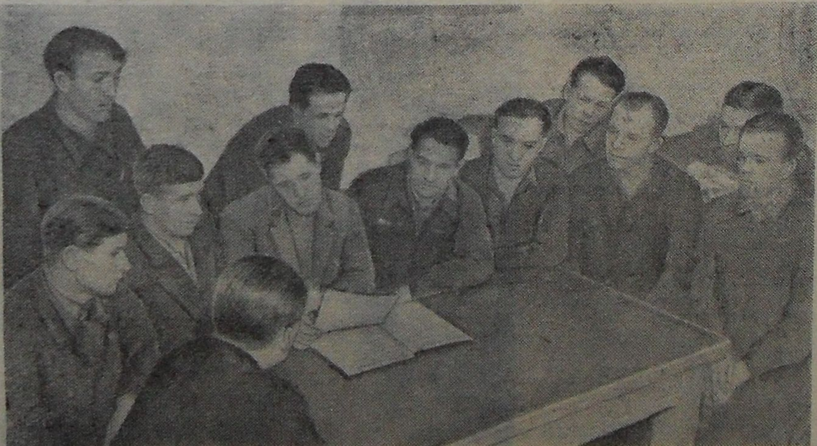
Ремонтная группа участка вентиляции и отопления Лаборатории высоких энергий три квартала 1961 года удерживала первое место в социалистическом соревновании коллектива отдела главного энергетика.

Сейчас в электротехническом отделе Лаборатории ядерных проблем стало три бригады коммунистического труда. Профбюро лаборатории надо решать вопрос о присвоении звания коммунистического всему отделу.