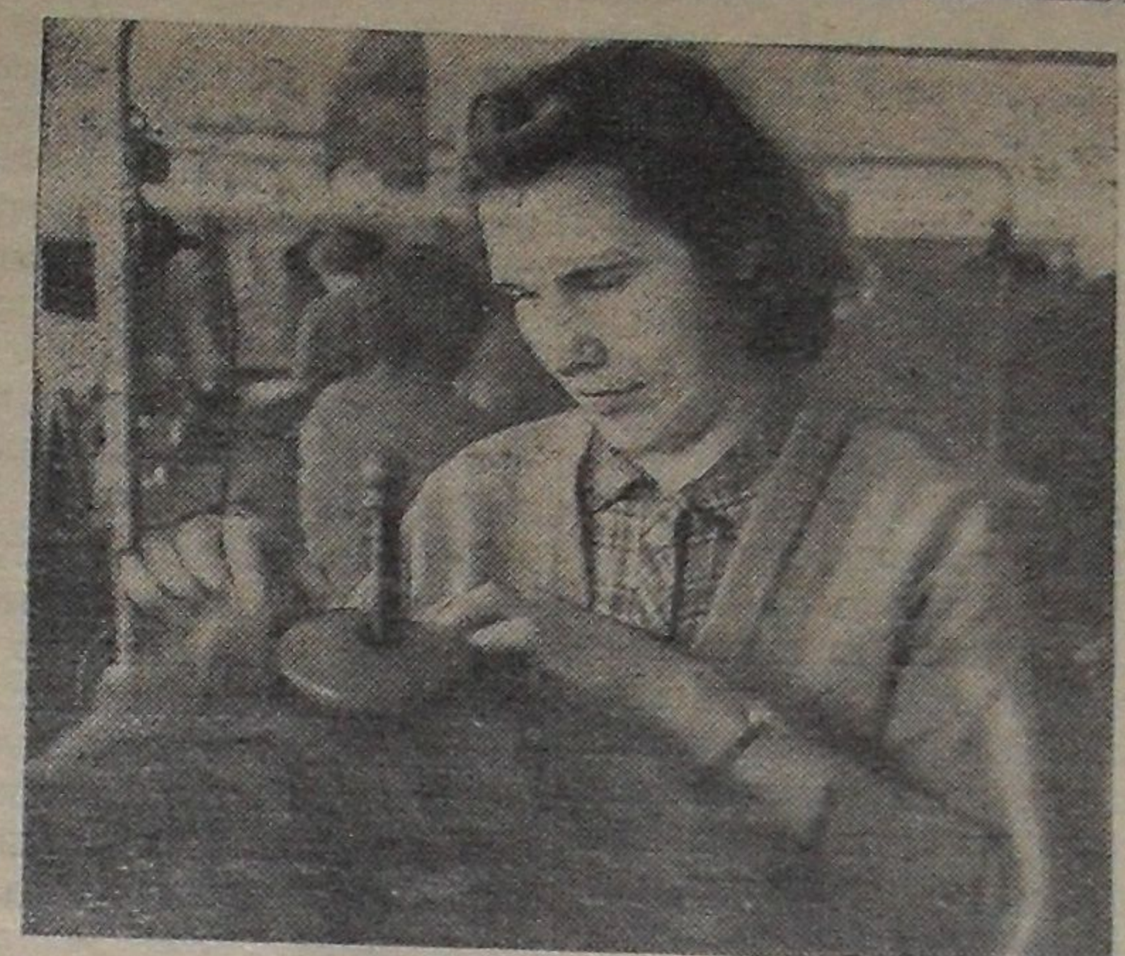
Коллектив комбината бытового обслуживания (институтская часть города) готовится достойно встретить Пленум ЦК КПСС.

Широкий размах получило социалистическое соревнование в честь 45-й годовщины Октября и у нас в Дубне. Каждый рабочий, инженер, физик, техник, строитель считал своим долгом подготовить Великому Октябрю посильный трудовой подарок. Это соревнование не затухает и сейчас. На строительных площадках левобережья, в институтской части города, в лабораториях, отделах, механических мастерских Института, на предприятиях и в учреждениях Дубны царит трудовой подъем, коллективы стремятся досрочно выполнить годовые планы и задания. Гордое имя — строитель коммунизма — вдохновляет трудящихся Дубны на то, чтобы сегодня работать лучше, чем вчера, завтра — лучше, чем сегодня.