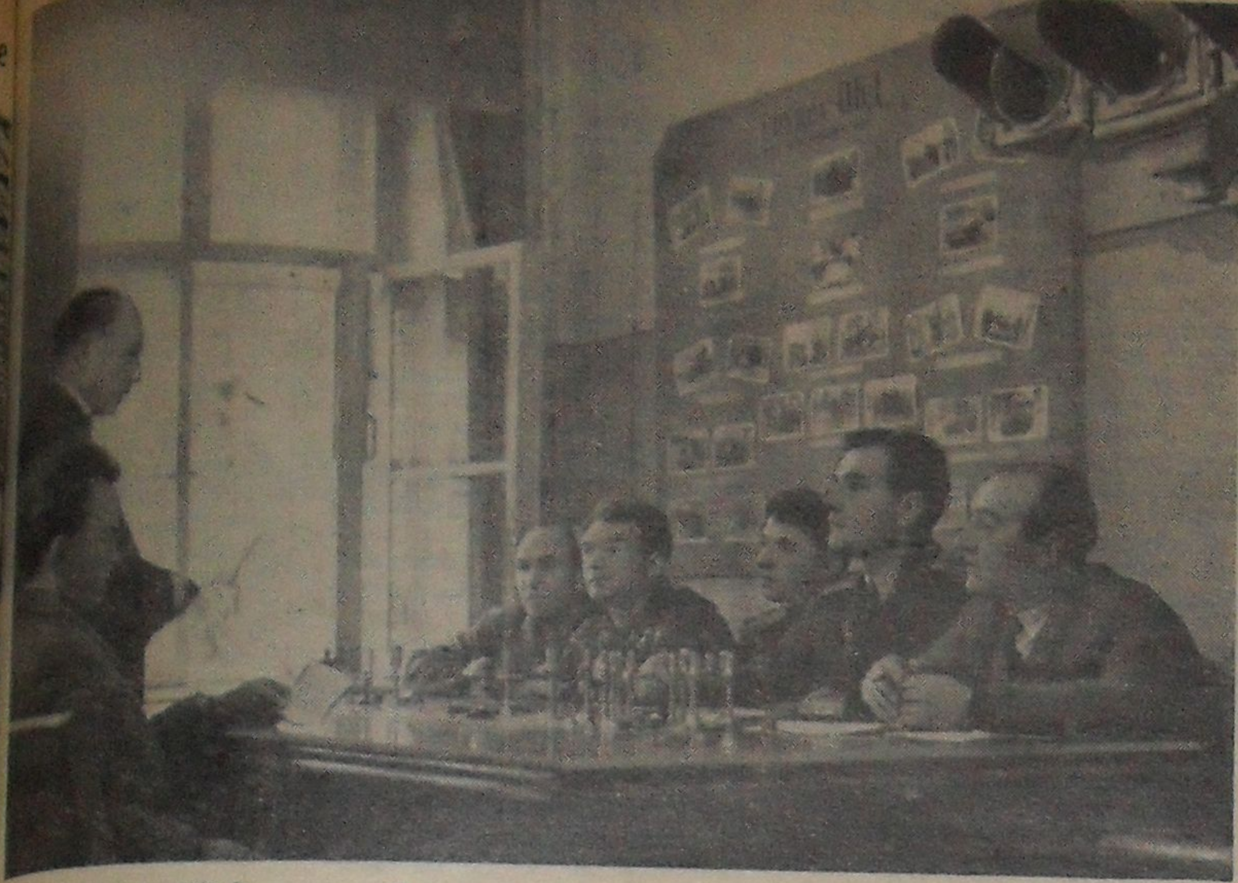
В этом году первичными организациями ДОСААФ города подготовлена группа шоферов для нужд народного хозяйства. В этой большой работе практическую помощь оказывает ГАИ г. Дубны.

одной стране е, богатом нефтью и природными урении самовый закон. В являющаяся одним из главных автопокрышек, шинный завод наместо послужит полупутьм намечено сдать в эксплуата нологической установкой № 1 самесборных камер.