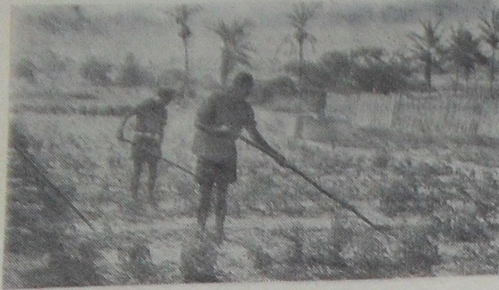
Республика Сенегал. Около 95 процентов населения страны занято в сельском хозяйстве.