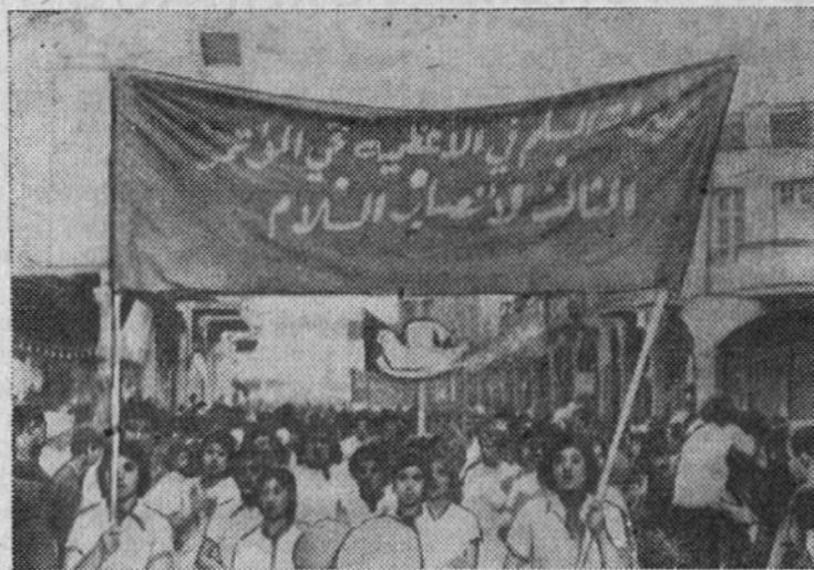
Иракский народ активно выступает в защиту мира, за всеобщее разоружение и запрещение атомного оружия.

Первая программа 12.00 — Кинорепортаж о наших днях. 12.20 — Новый киноочерк «Резерв плодородия». 12.40 — Телевизионные новости. 17.25 — Для младших школьников. «А ну-ка, призадумайся!». 17.55 — Телевизионные новости. 18.10 — «Искусство». Телевизионный журнал. Передача из Вильноса. 19.00 — Чемпионат мира по гимнастике. Передача из Праги. 20.30 — Славен труд. Рассказ о людях и делах Горьковского экономического района. 21.00 — Художественный фильм «Костры горят». 22.30 — Главная проблема современности. Выступление делегатов Всемирного конгресса за всеобщее разоружение и мир. 22.40 — Телевизионные новости. 23.00 — Советский романс. Романсы композиторов И. Ильина и А. Сивастьянова.