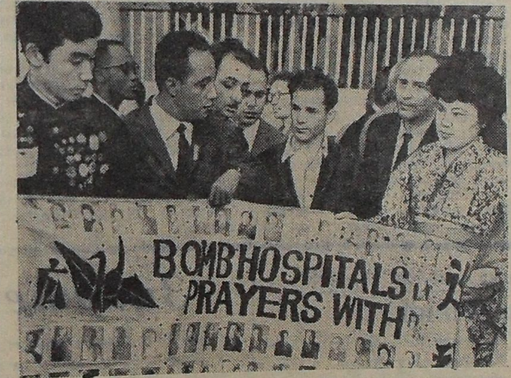
МОСКВА. Всемирный конгресс за всеобщее разоружение и мир. На снимке: представители Японского города Хиросима показывают делегатам конгресса плакаты с портретами жертв атомной бомбардировки.