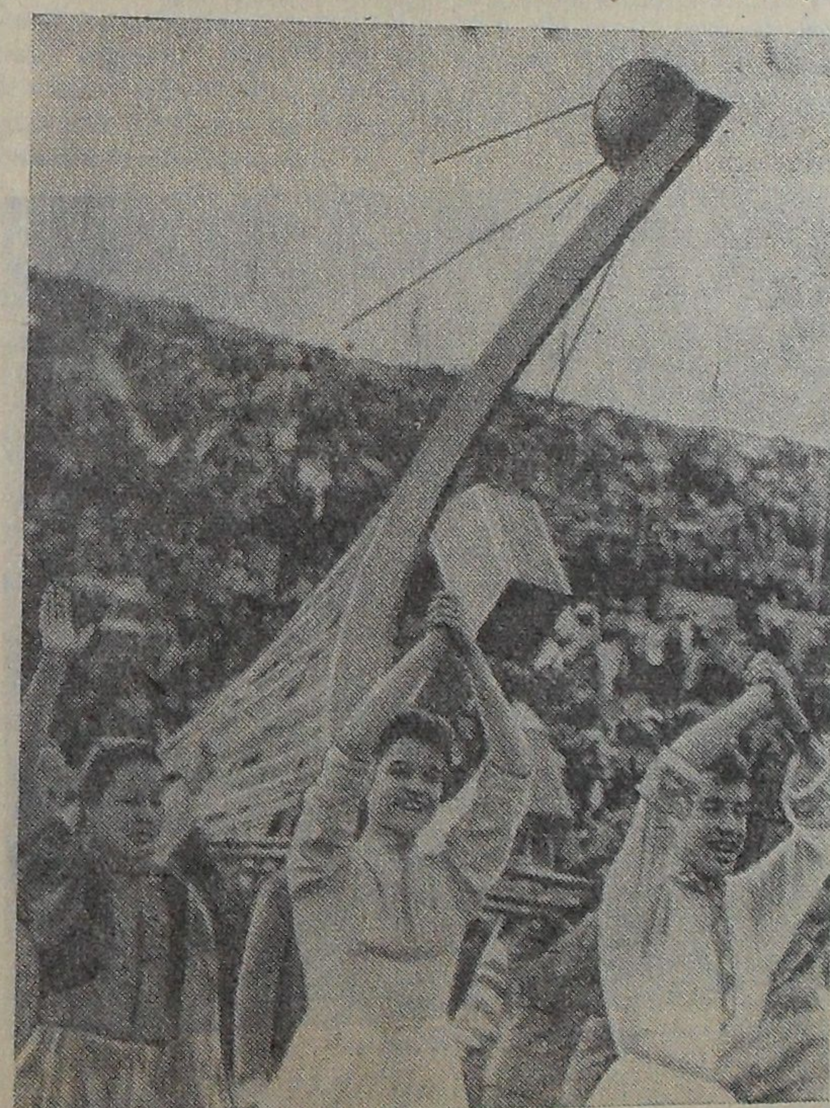
ХЕЛЬСИНКИ. Открытие VIII Всемирного фестиваля молодежи и студентов «За мир и дружбу». На снимке: делегаты Советского Союза проходят по Олимпийскому стадиону. Фото специальных корреспондентов ТАСС Е. Кассина и В. Генде-Роте. (Принято по фототелеграфу).