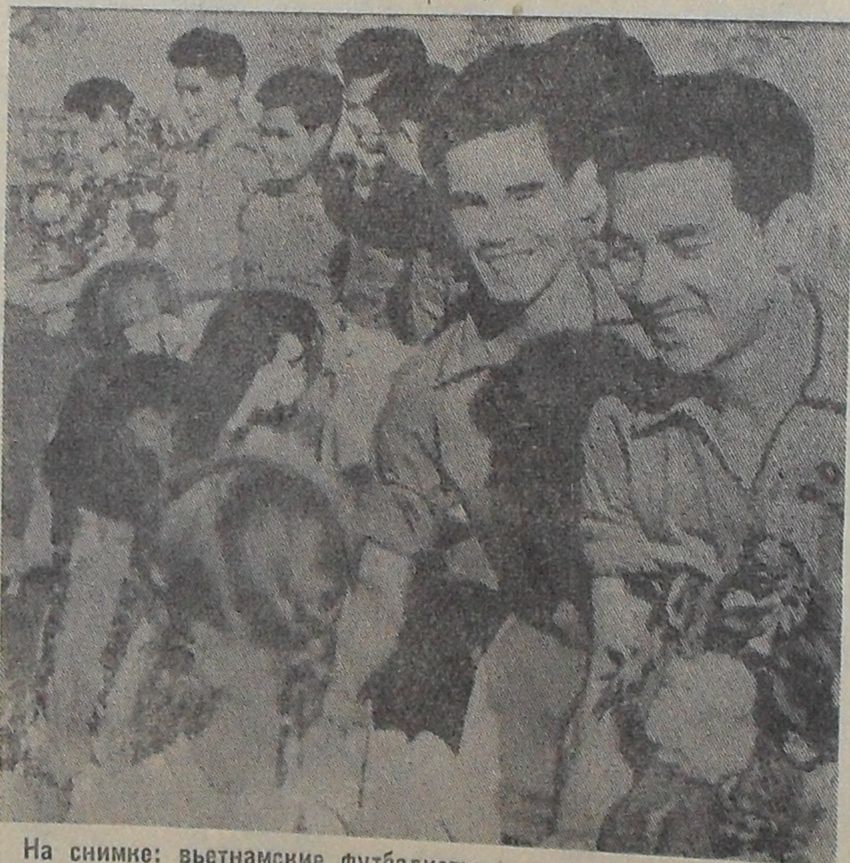
На снимке: вьетнамские футболисты.

— Безусловно, этот матч мы выиграли с помощью ваших болельщиков. Ваши футболисты хорошо играют, и мы учимся у вас настоящей игре. Мы в Советском Союзе играли несколько игр с разными командами. Эти игры для нас тренировки перед предстоящей спартакиадой дружественных армий. Она начнется через несколько дней в Праге. Наша команда попала в группу футболистов Польши и ГДР. Вьетнамские футболисты благодарят дубненских болельщиков за сердечный прием.