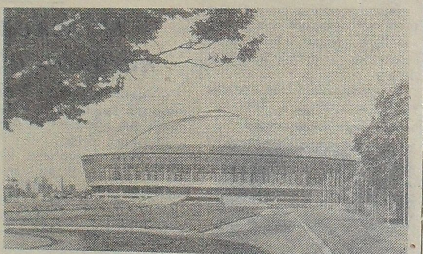
На снимке: выставочный зал Выставки достижений народного хозяйства Румынии.