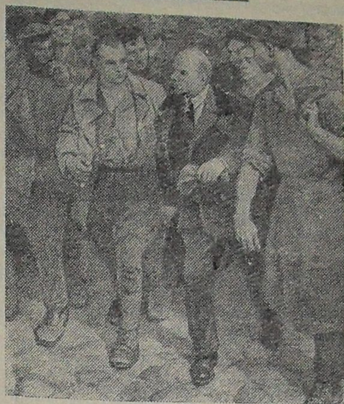
«С Лениным» — картина художника В. А. Серова, выдвинутая на соискание Ленинской премии 1963 года.

— угол наклона орбиты к плоскости экватора — 48 градусов 57 минут. Кроме научной аппаратуры, на спутнике имеются: — радиопередатчик, работающий на частоте 20,004 мегагерц; — радиосистема для точного измерения элементов орбиты; — радиотелеметрическая система для передачи на Землю данных о работе прибора и научной аппаратуры. Установленная на спутнике аппаратура работает нормально. Координационно-вычислительный центр ведет обработку поступающей информации.