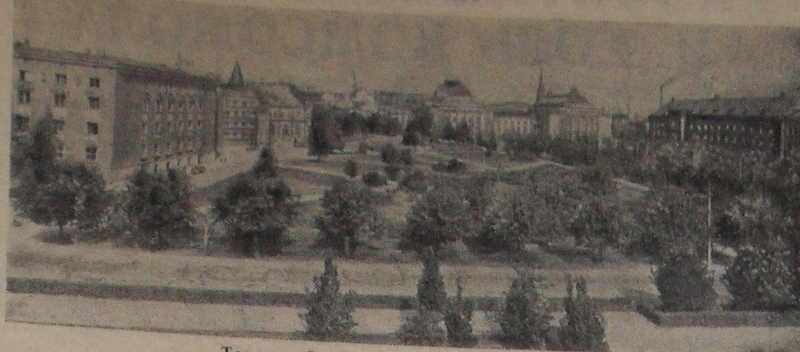
Таллин. Сквер у театра «Эстония».

К 20-летию (25 сентября 1944 г.) освобождения Эстонии от немецко-фашистских захватчиков