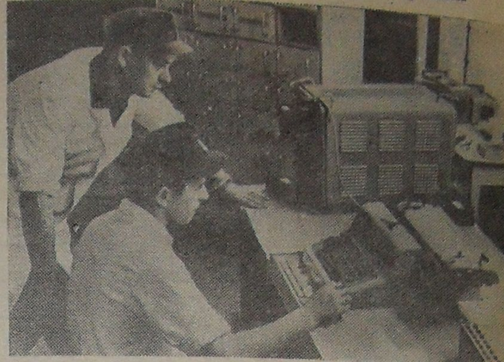
Первая электронно-счетная машина появилась в рыбной промышленности Германской Демократической Республики. Эта установка (на снимке) будет служить диспетчерским пультом для производящей экономические расчеты, на выполнение которых обычно затрачивалось не менее двух дней.

На снимке: испытание установки.