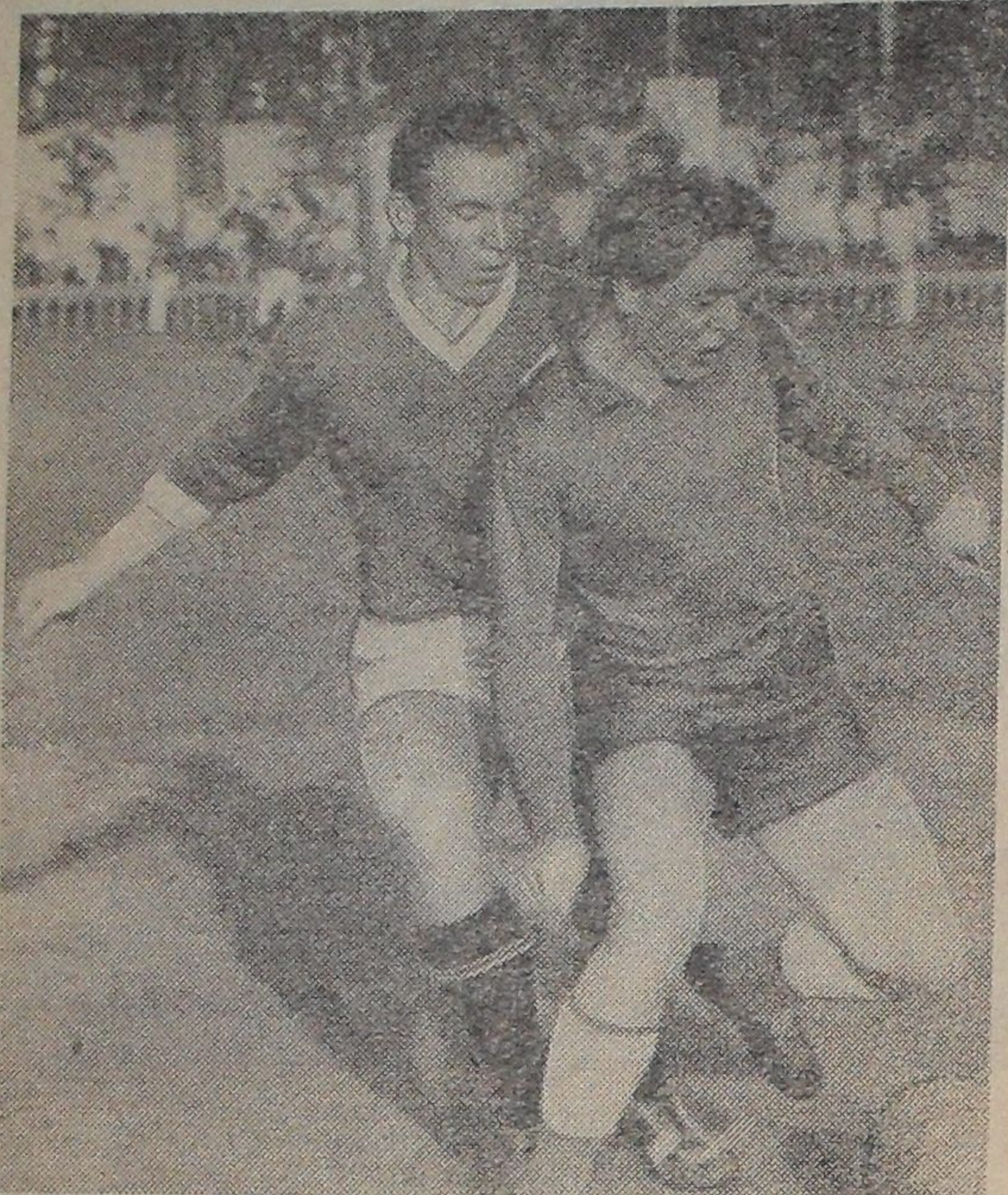
На снимке: момент игры (Институт — левобережье). Победили спортсмены Института со счетом 2:1.