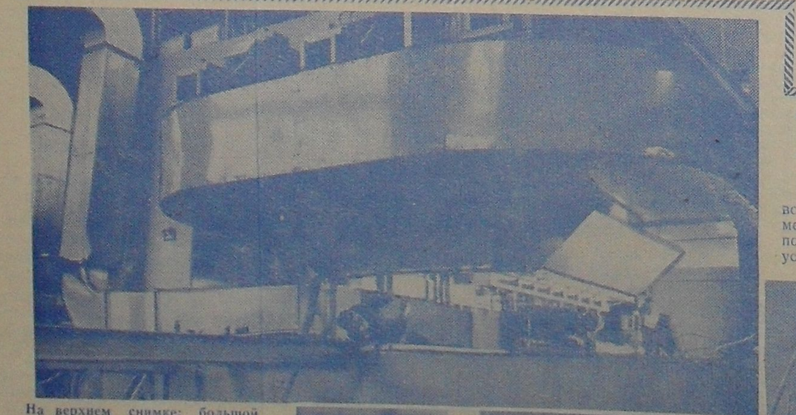
На верхнем снимке: большой магнит двухметровой пропановой камеры.