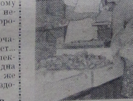
КОНДИТЕРСКИЙ ОТДЕЛ МАГАЗИНА «ВОЛГА».

Представители партийных, советских, общественных организаций города и воинов Краснознаменного Черноморского флота на торжественном собрании отметили знаменательную дату.