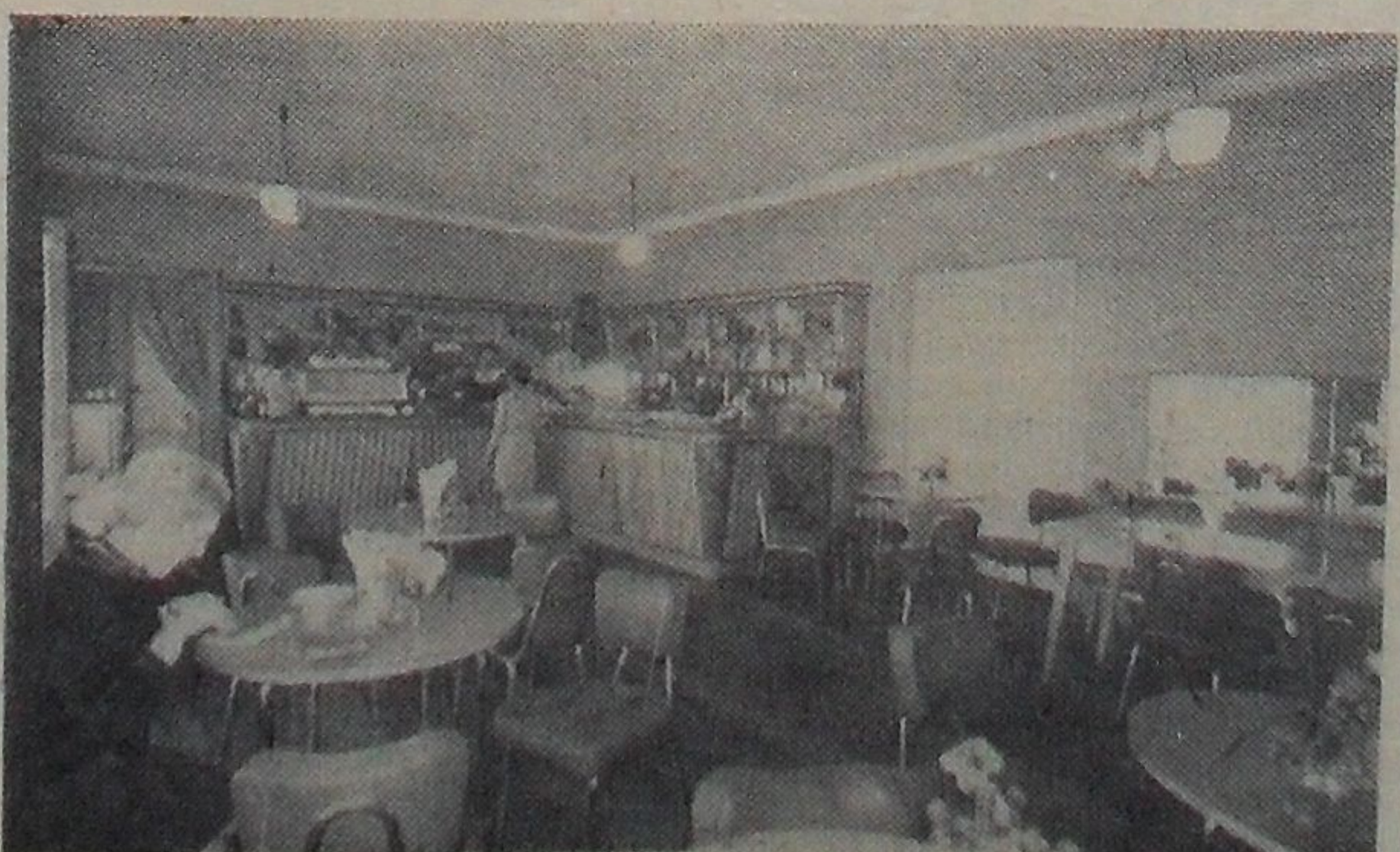
На снимке: в зимнем помещении кафе.