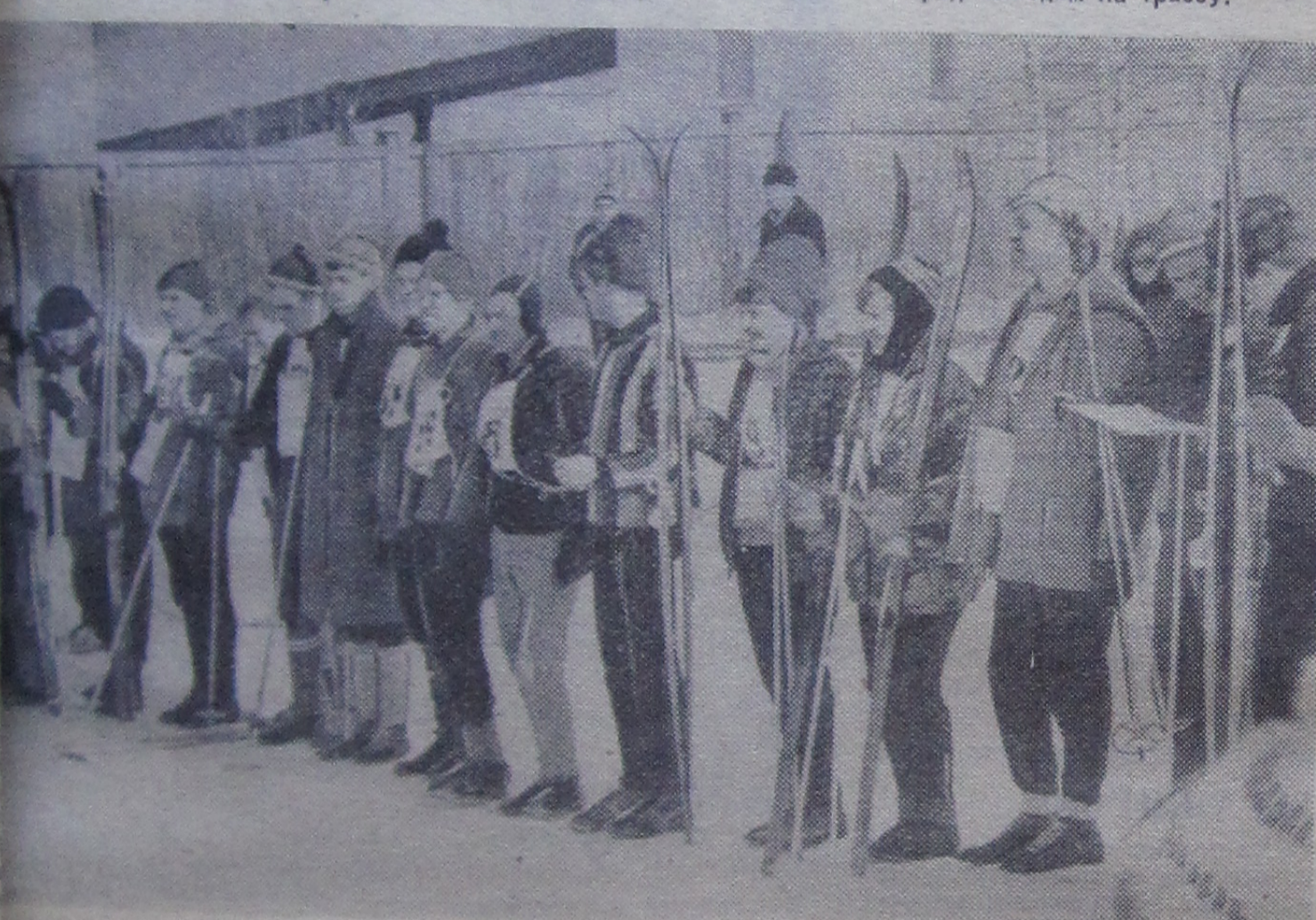
А судьи кто?..

Дубне туристская секция «Труд» организует регулярные соревнования по ориентированию — на летних и осенних туристских слетах, а зимой — в Дня Советской Армии. В начале марта на стадионе «Труд» был дан старт турнирам соревнований по ориентированию на маркированной трассе, ставших последними в зимнем сезоне. Трасса протяженностью 12 км, у женщин — 8 км, у мужчин — 12 км, у мужчин — 18 км, у мужчин — 37. Это говорит о том, что интерес к ориентированию среди сотрудников Института возрастает (в прошлом году была только команда от ЛВЭ и ЛВТА).