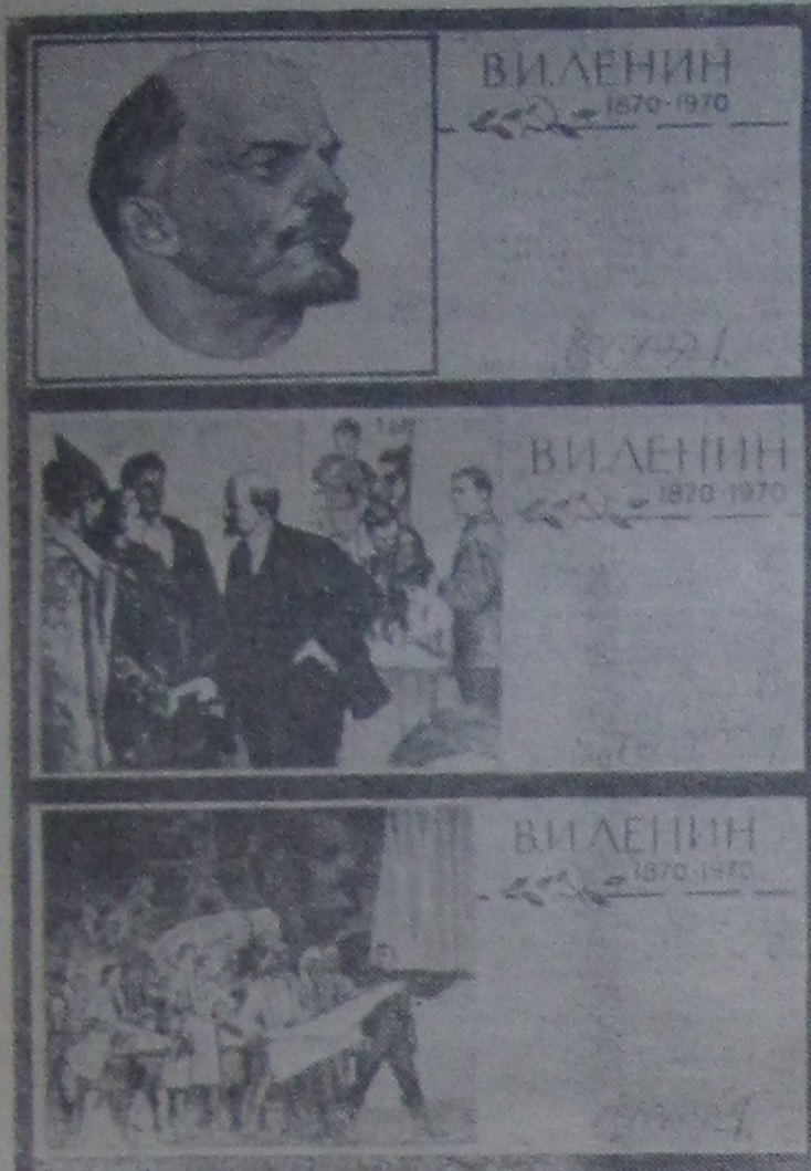
Москва. Министерство связи СССР готовит к выпуску серию марок «В. И. Ленин (1870 — 1970)».