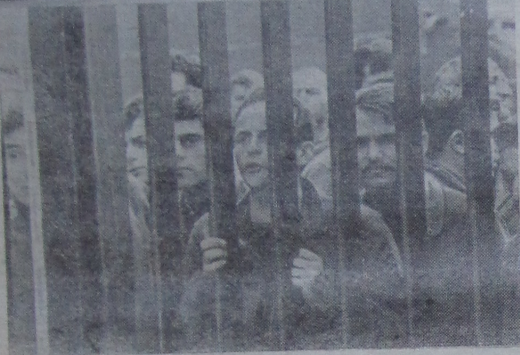
Москва. Международная выставка художественной и документальной фотографии, посвященной 100-летию со дня рождения В. И. Ленина, в Центральном выставочном зале. В выставке участвуют фотожурналисты, мастера художественной фотографии, фотодолюблиатели Советского Союза и зарубежных стран.