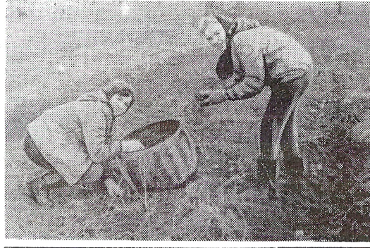
Из зала суда