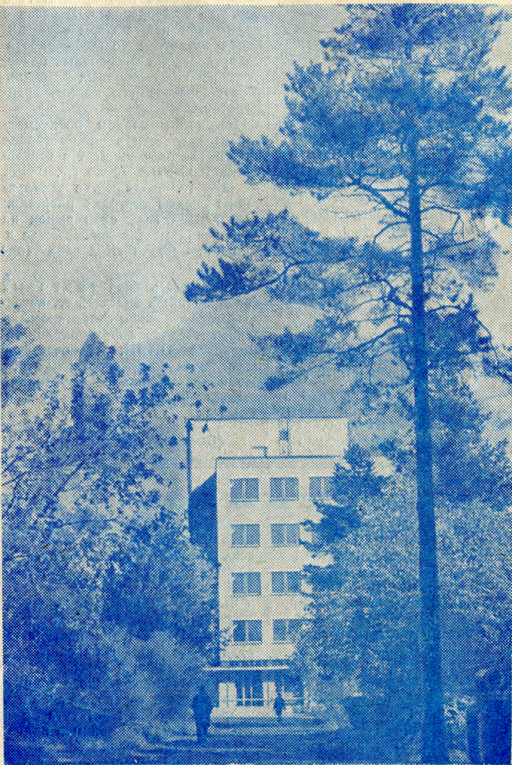
Новый корпус Лаборатории ядерных проблем.