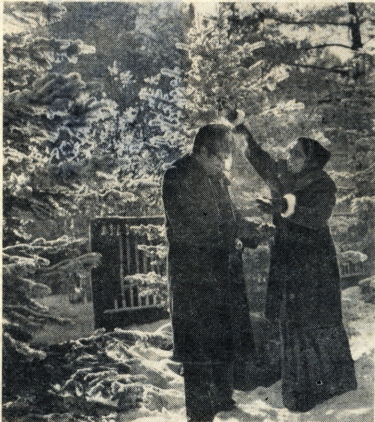
«БЕЛЫЙ СНЕГ, РУССКИЙ СНЕГ, ДОБРЫЙ СНЕГ...»

Вечер состоится 9 марта 1973 года в 18 час. 30 мин. в ДК.