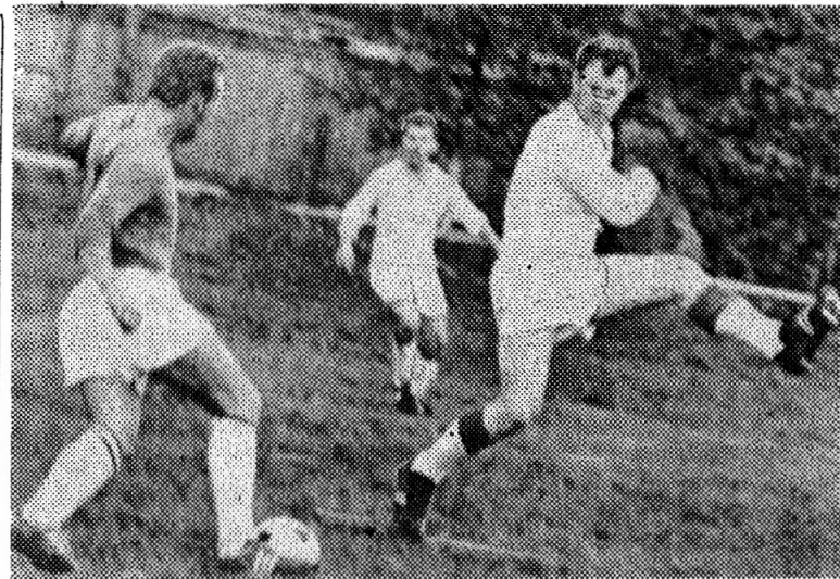
Заканчивается чемпионат области по футболу среди команд второй группы. Мужская команда ДСО «Труд» занимает в турнирной таблице первое место.