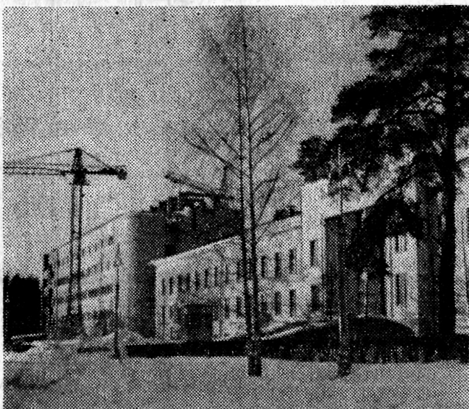
Фото Ю. Туманова.

На снимках: здание № 131, состоящее из двух разноэтажных блоков (вверху — лабораторный корпус, внизу — здание, где будет смонтирован новый ускоритель).