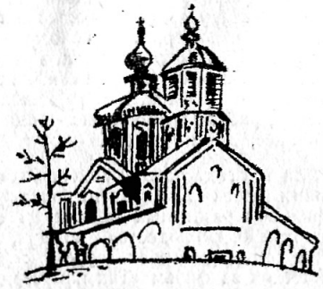
Торopez, Богоявленская церковь. 1764 год.